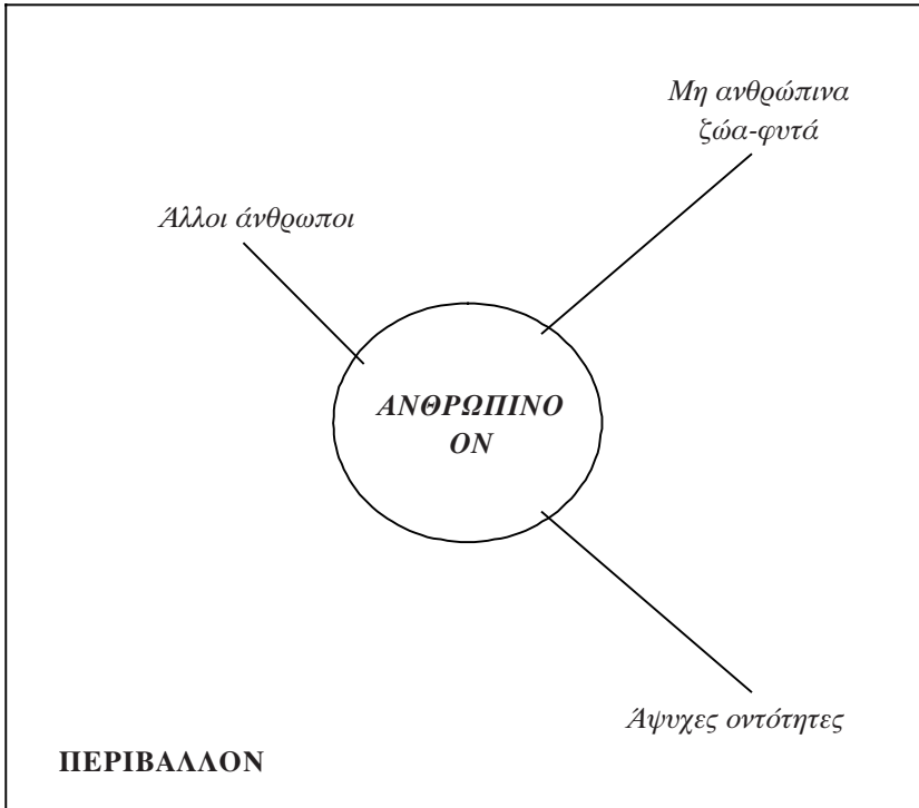
Η αντίληψη των κυνηγών-συλλεκτών για το ανθρώπινο ον (Ingold 1996:127)

εννοεί κάτι τέτοιο. Στις μέρες μας ακούμε –και λέμε– πολύ συχνά τη «Μάνα Γη», ενώ έχουμε όλοι μας μια «κανονική» μητέρα –εκείνη που ενίοτε μας τηλεφωνεί και μας ρωτά αν φάγαμε και αν ντυνόμαστε ζεστά: όταν λέμε ότι η Γη είναι «μάνα» μας προφανώς δεν το εννοούμε με την «ανθρώπινη» έννοια που αποδίδουμε σε αυτό τον όρο. Για τις κοινότητες όμως στις οποίες αναφέρομαι, τέτοια διάκριση δεν υπάρχει· ή, πιο απλά, δεν υπάρχει η διάκριση «άνθρωπος» – «ζώο»/«φυτό» (όπου ο πρώτος όρος είναι ένα πρόσωπο και ο δεύτερος ένας οργανισμός ). Γι' αυτούς τους ανθρώπους 16 υπάρχουν μάλλον «πρόσωπα-οργανισμοί» που μπορούν να είναι άνθρωποι, ζώα ή φυτά. Αυτή η διαφορά σχέσεων ανθρώπου-φύσης μεταξύ της δυτικής σκέψης και της σκέψης των κυνηγών-συλλεκτών αποδίδεται γραφικά πιο πάνω.